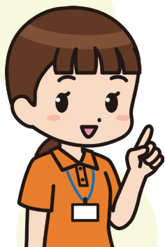
(PT・OT) 理学・作業療法士

リハビリではご利用者の意欲を引き出してくれています。何か工夫している点がありますか？