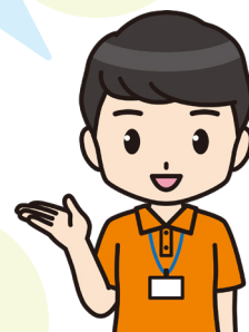
理学・作業療法士 (PT・OT)

言語聴覚士は 火曜日・木曜日・金曜日・土曜日 対応可能です。 時間や地域の詳細はお気軽に お問い合わせください。