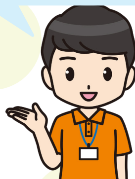
理学・作業療法士 (PT・OT)

退院後、体調が落ち着くまで 看多機 を利用し、 その後、 元の居宅 に戻っていただくという 利用方法もございます。