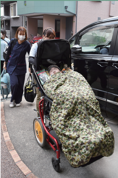
通所施設から帰宅。医療的ケアの機器も持ち運びながら、看護師とヘルパーがお母様とともにM様を迎え入れます。