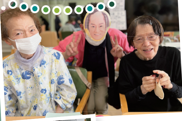
あの演歌歌手!?! と一緒に!