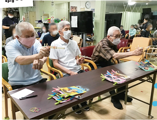
的を狙って真剣勝負

今年は各地の花火大会が復活しているように、夏のお祭りが戻りつつありますね。リニエデイサービス岸和田でも、恒例の夏祭りを開催しました!今年の種類は、射的、魚釣り、輪投げです☆全種目、得点形式でアツク盛り上がった後はアイスでクールダウンして、ご利用者の笑顔がたくさん見ることが出来ました!最近では異常なまでの暑さが続いています。体調に気を付けて休まずデイサービスに来ていただいで、ご利用者の皆様と楽しい時間を過ごしたいです。