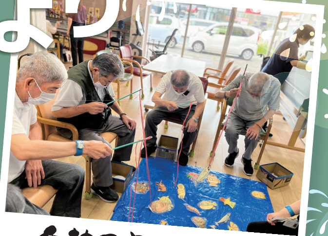
白熱のさかな釣り