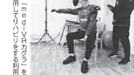
▶「VRリハをする利用者」

また、福井那奈管理は「ブラックジャックでは普段寡黙な男性利用者もゲームに勝つとカッパゲームを決めるなど、皆夢中で楽しんでい」と話す。今後はグループ内のデイ事業所間でオンラインダーツ対抗戦なども検討している。2階では運動に力を入れたメニューを提供する。認知機能を高めるなど、皆夢中で楽しんでい」と話す。